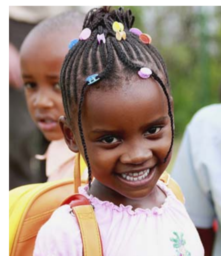
Freundlich und aufgeschlossen sind in Tansania nicht nur die Kinder.