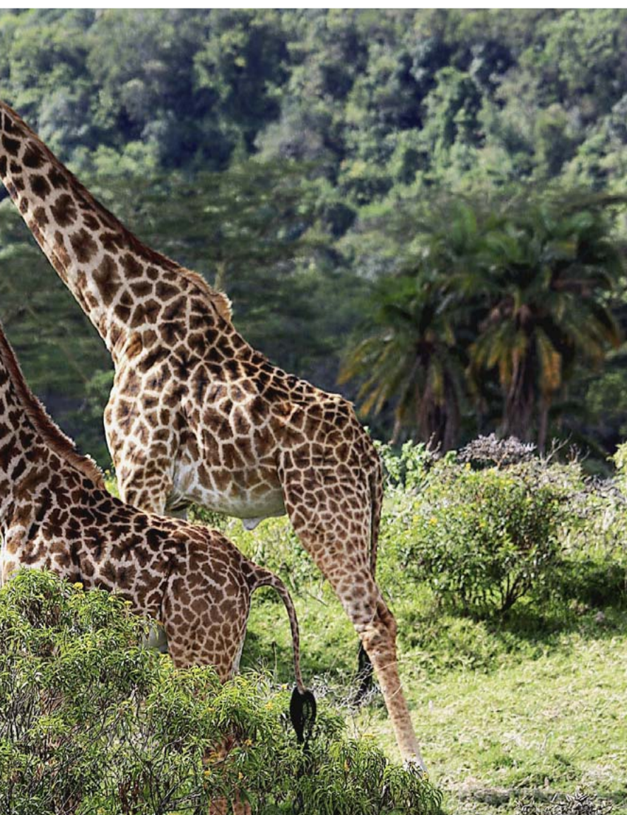
Riesengroß, aber friedlich: Giraffen.

Die Autorin war Gast von Ethiopian Airlines und Diamir Erlebnisreisen.