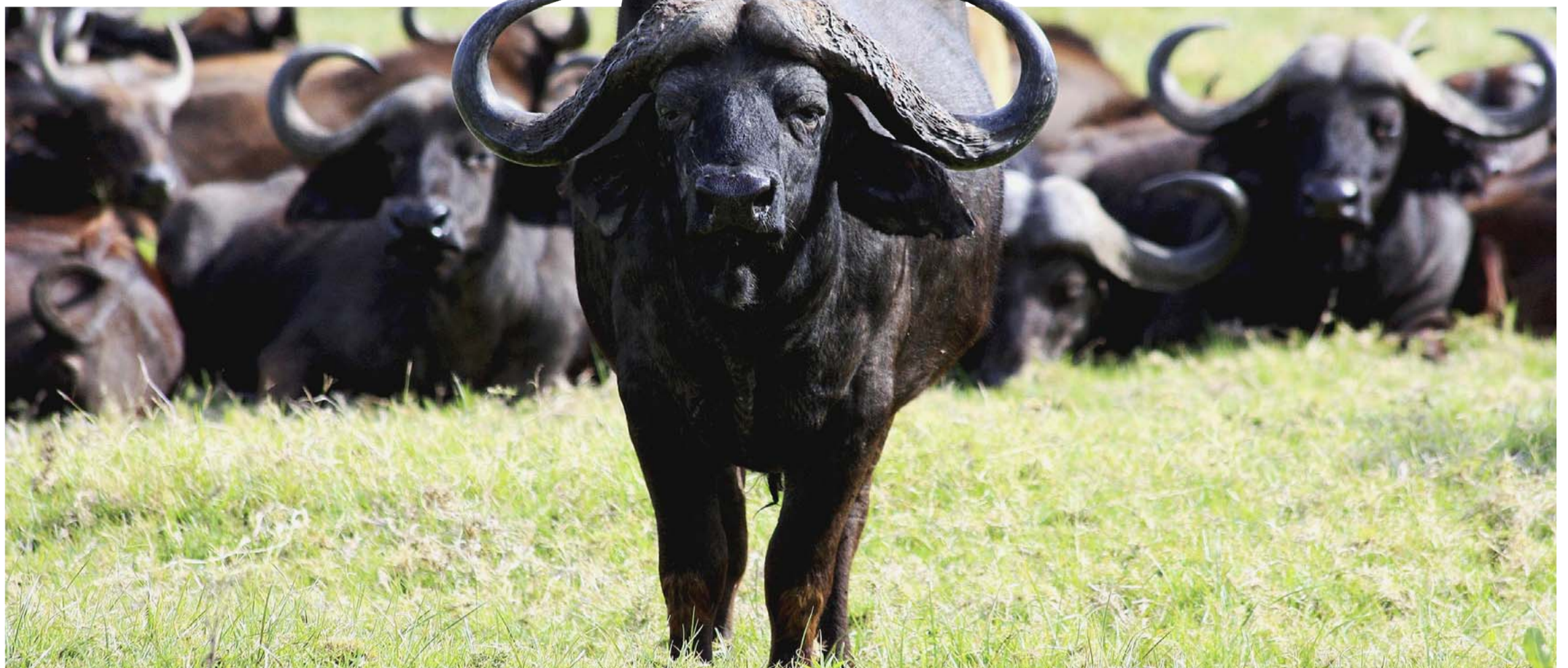
Kaffernbüffel: Sie sind die gefährlichsten Tiere im Arusha-Nationalpark in Tansania.

Im Norden von Sri Lanka herrscht weiter Bürgerkrieg. Vor Reisen in Gebiete nördlich der A 12, die von Puttalam im Westen bis Trincomalee im Osten verläuft sowie in die Ostprovinzen (Bezirke Trincomalee, Batticaloa und Ampara) wird deshalb gewarnt. red